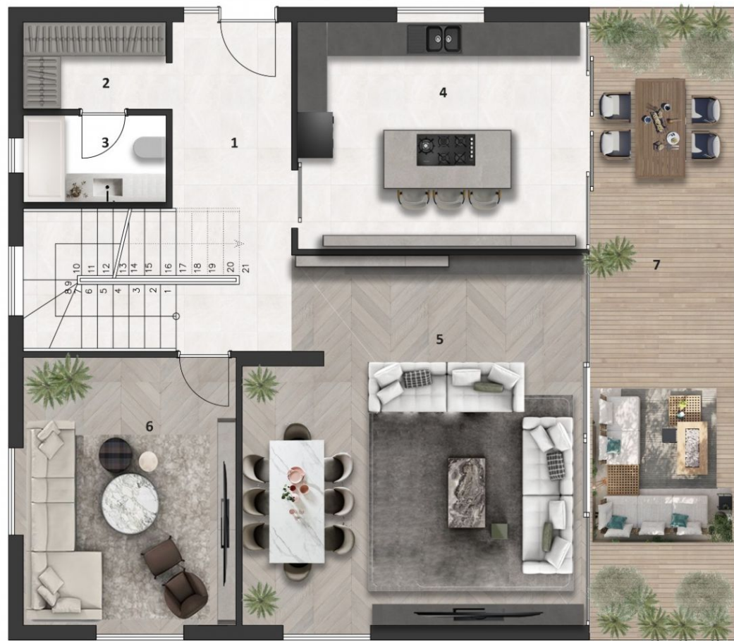
VİLLA 1 ZEMİN KAT PLAN BALKONSUZ NET ALAN : 88.91 M 2 BALKONLU NET ALAN : 116.03 M 2