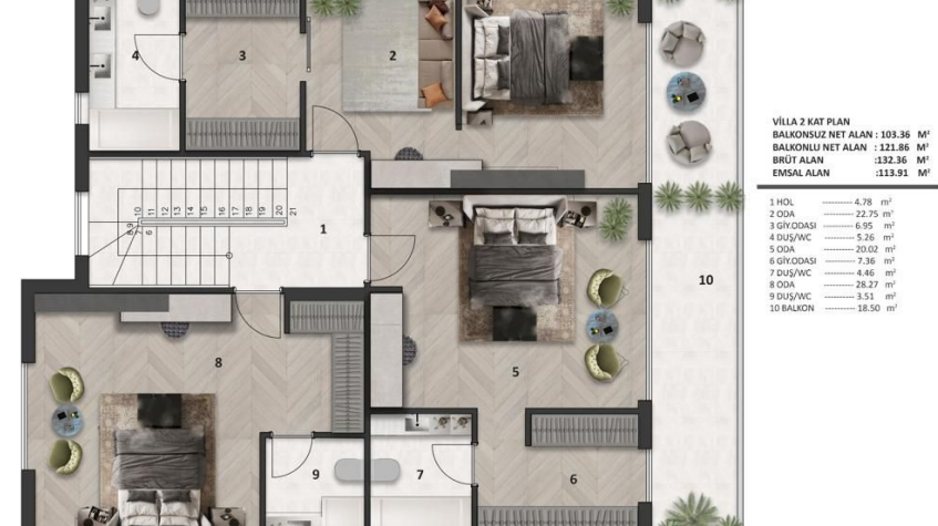
VİLLA 2 KAT PLAN BALKONSUZ NET ALAN : 103.36 M 2 BALKONLU NET ALAN : 121.86 M 2 BRÜT ALAN : 132.36 M 2 ENSAL ALAN : 113.91 M 2